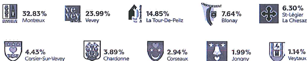
Parts des 10 Communes propriétaires de VMCV SA

Pour mémoire les communes propriétaires des VMCV avec leurs parts respectives: