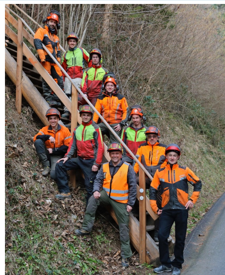
L'équipe des forestiers de Villeneuve-Veytaux

Une activité sera également organisée à Champ Babau avant les fêtes de Noël.